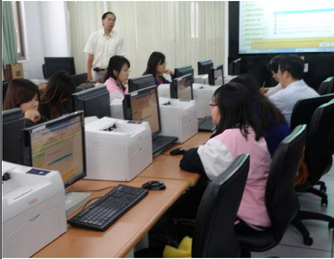
▲ 大家操作起來更起勁了