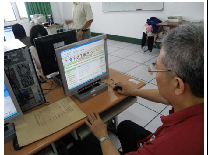
▲ 老師也會實際操作