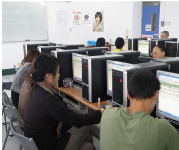
▲ 老師們都很認真喔