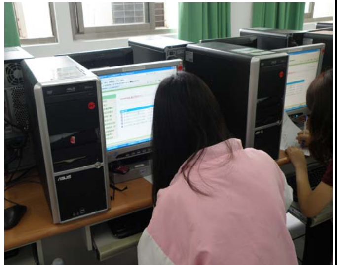
▲ 同學們也很認真的製作