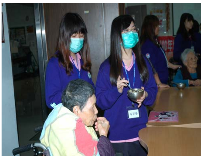
▲ 充滿著感恩與感動的愛心