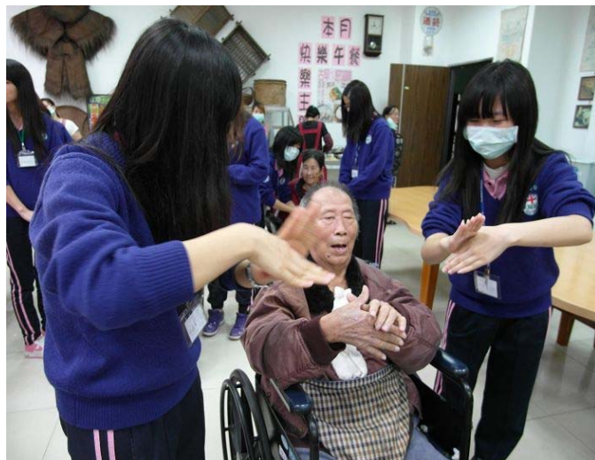
▲ 同學們輔佐著阿公阿嬤