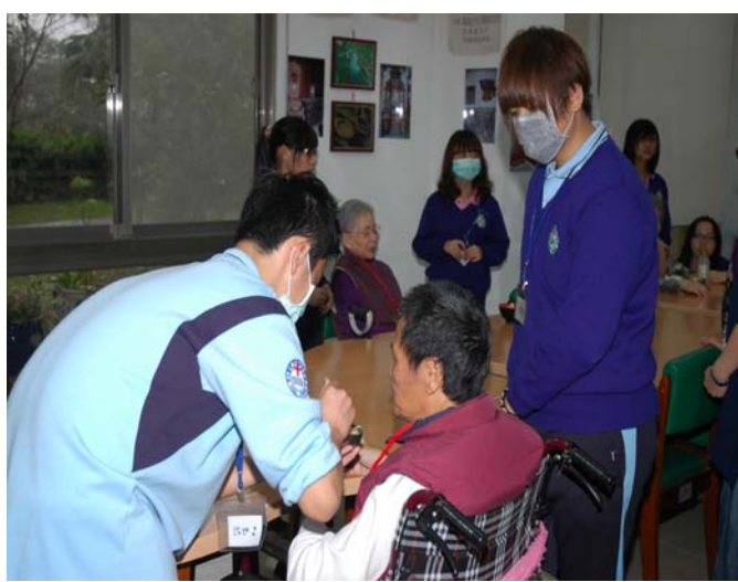
▲ 充滿著感恩與感動的愛心