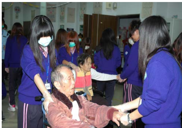
▲ 阿公阿嬤享受著按摩時光