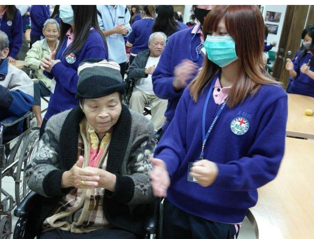
▲ 同學們輔佐著阿公阿嬤