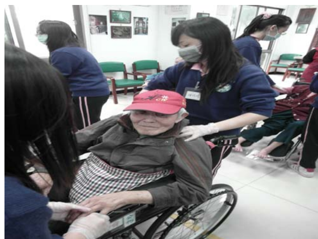
▲ 阿公阿嬤享受著按摩時光