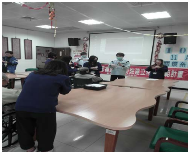
▲ 主持人也很賣力的在講解