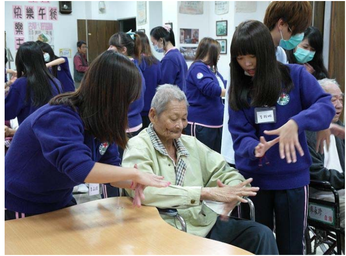
▲ 同學們輔佐著阿公阿嬤