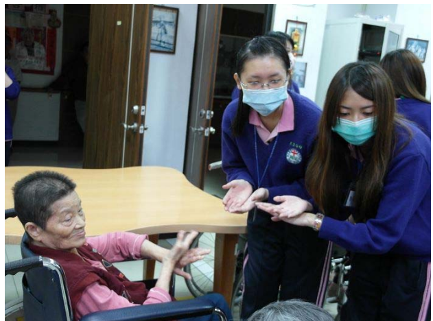
▲ 同學們輔佐著阿公阿嬤