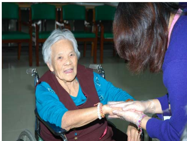
▲ 接下來進行手部保養