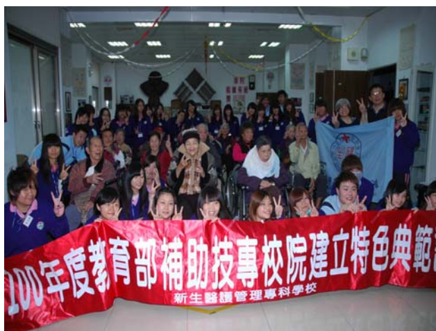
▲ 今天我們收穫了很多