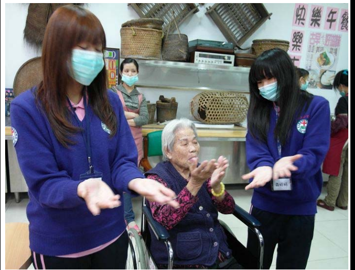
▲ 同學們也輔助著阿公阿嬤