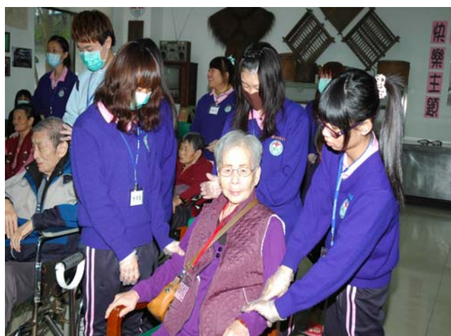
▲ 阿公阿嬤享受著按摩時光