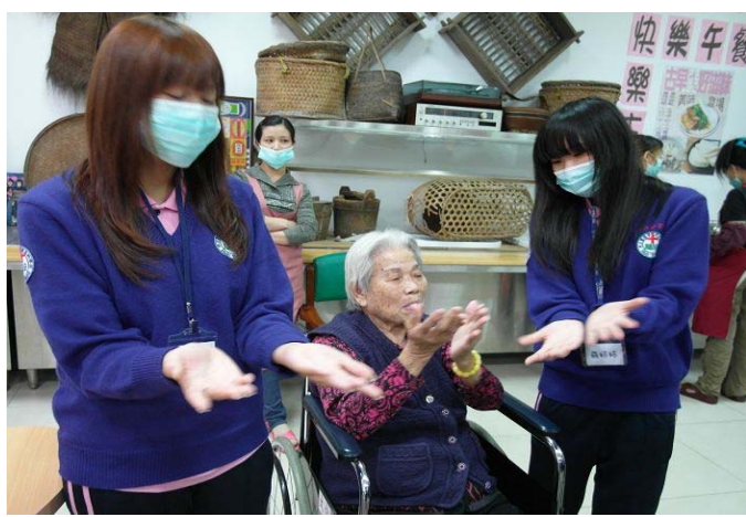
▲ 同學們輔佐著阿公阿嬤