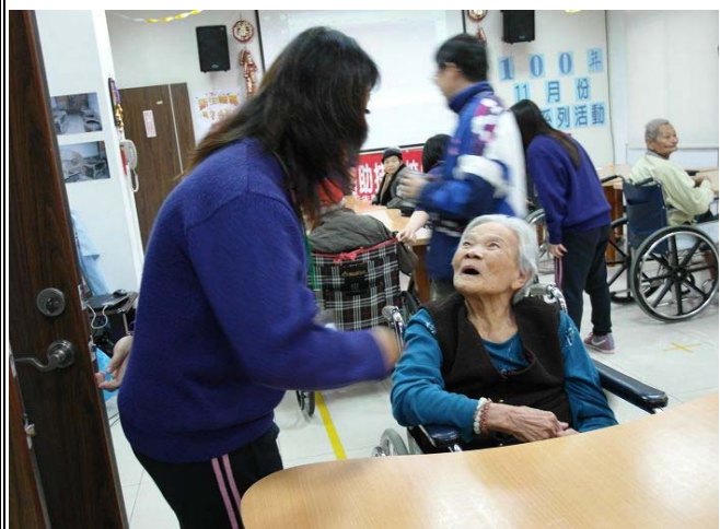
▲ 同學們紛紛幫阿公阿嬤拿點心