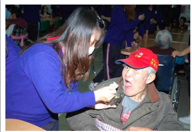
▲ 充滿著感恩與感動的愛心