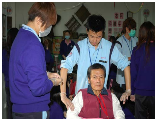
▲ 同時也進行肩頸按摩