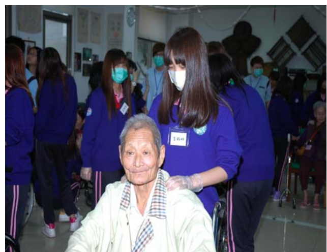
▲ 阿公阿嬤享受著按摩時光