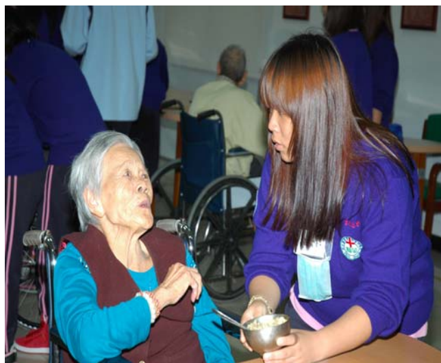
▲ 充滿著感恩與感動的愛心