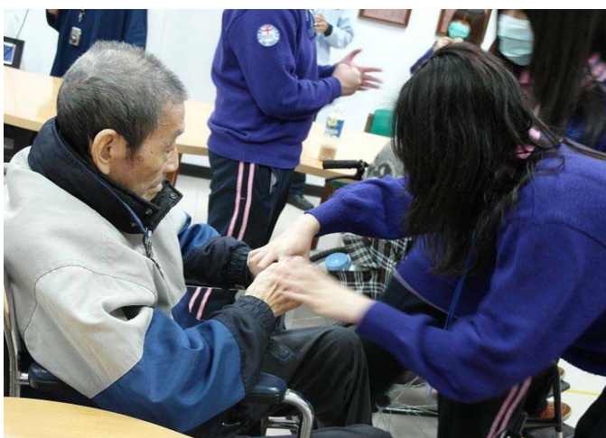
▲ 同學們輔佐著阿公阿嬤