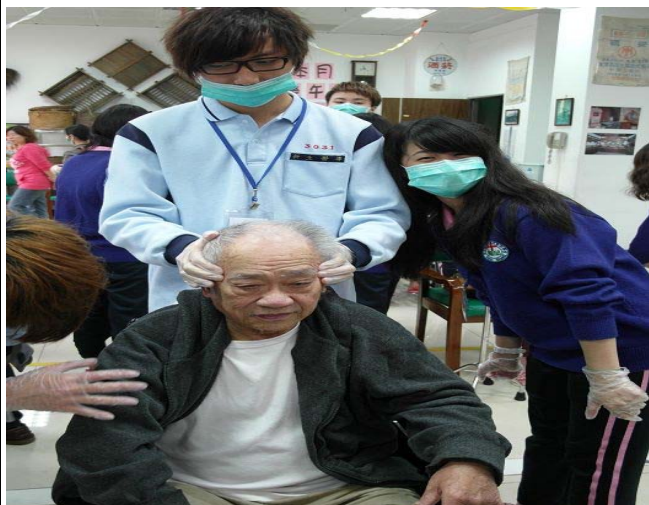
▲ 志工同學與阿公的合照