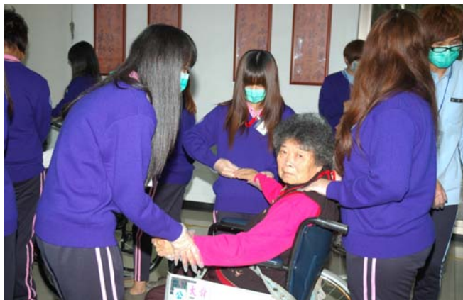
▲ 阿公阿嬤享受著按摩時光