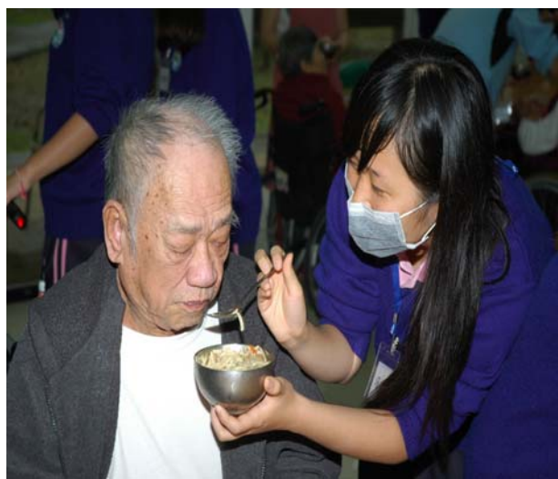
▲ 充滿著感恩與感動的愛心