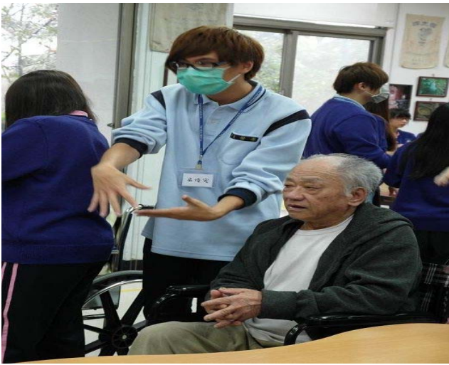
▲ 同學們輔佐著阿公阿嬤