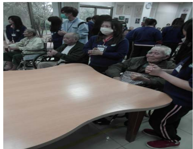
▲ 不過他們都很配合