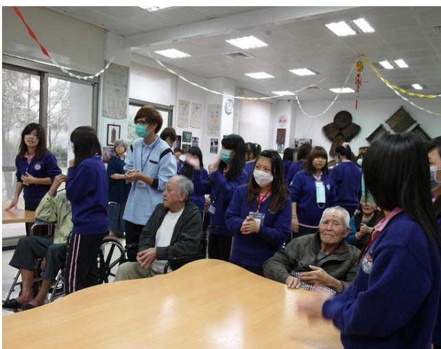
▲ 阿公阿嬤雖然動作沒有很靈活