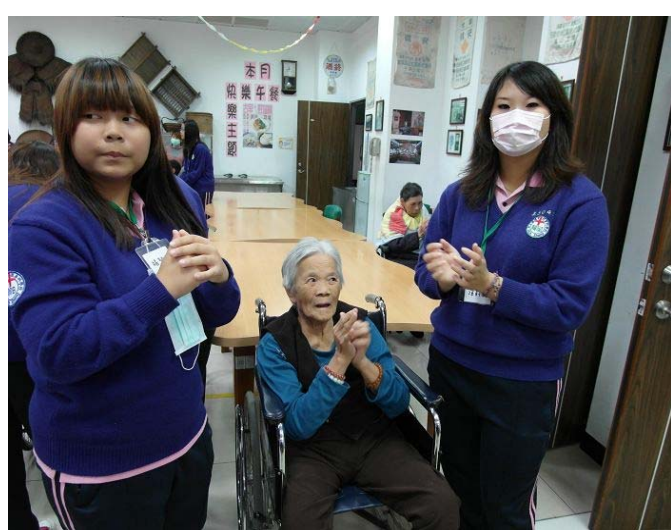
▲ 同學們輔佐著阿公阿嬤