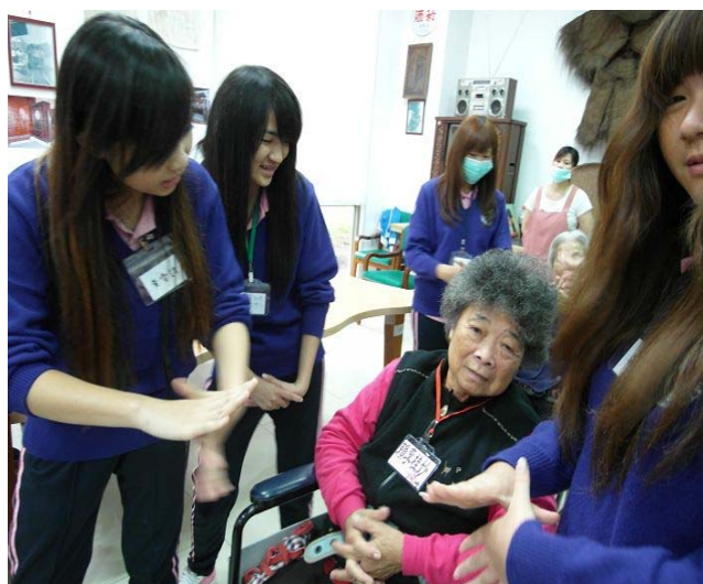
▲ 同學們輔佐著阿公阿嬤