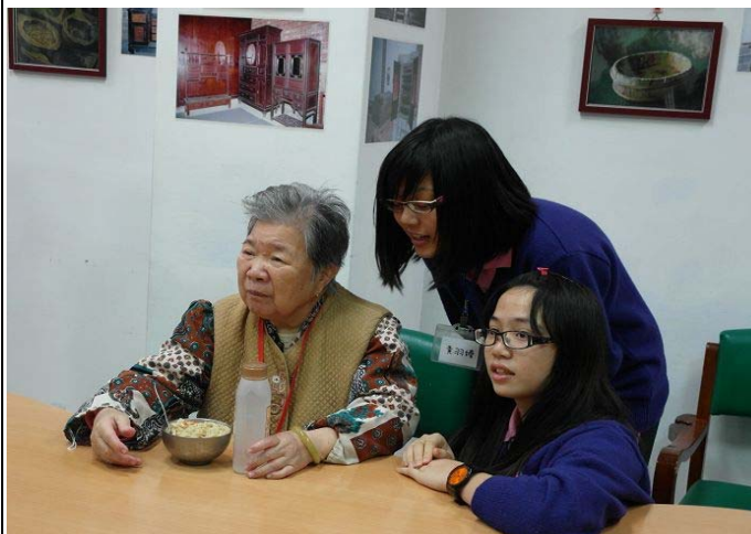
▲ 今天的點心是炒麵