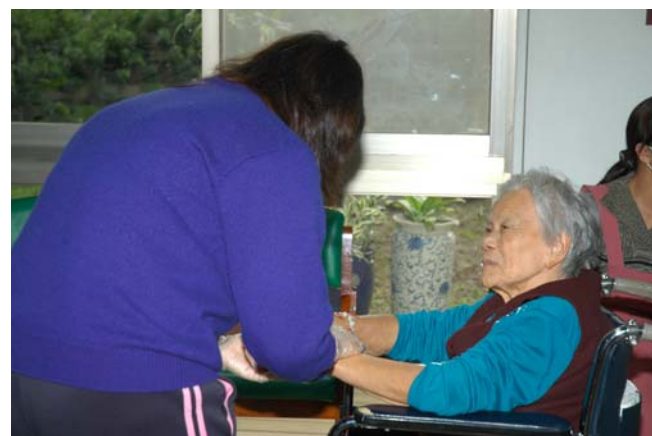
▲ 阿公阿嬤享受著按摩時光