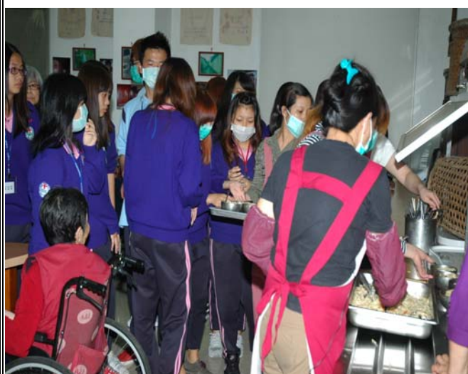
▲ 辛苦的社工們阿姨們