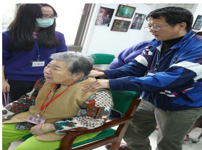
▲ 主任與阿嬤的合照