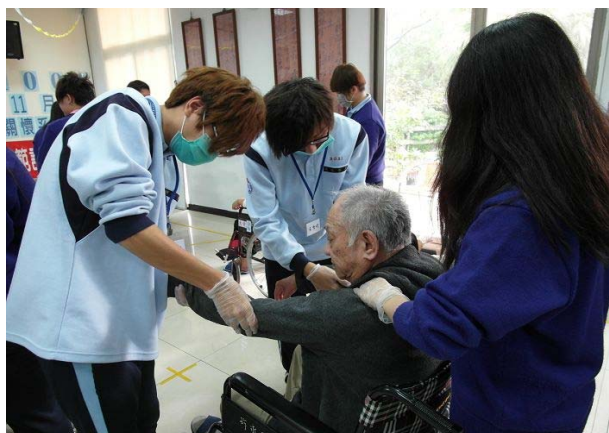
▲ 阿公阿嬤享受著按摩時光