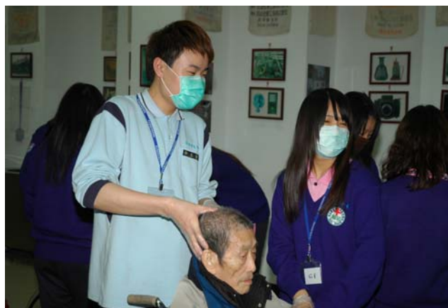
▲ 阿公阿嬤享受著按摩時光