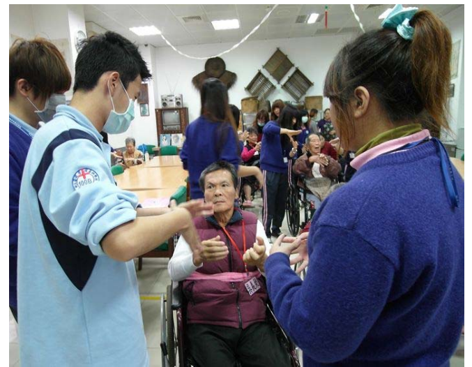
▲ 同學們輔佐著阿公阿嬤