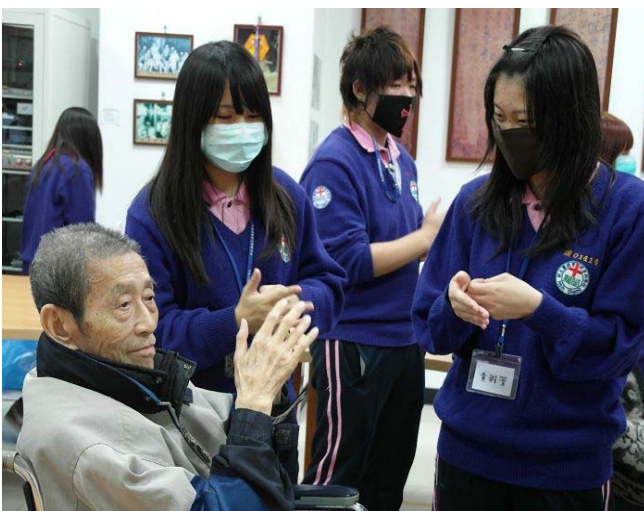
▲ 同學們輔佐著阿公阿嬤