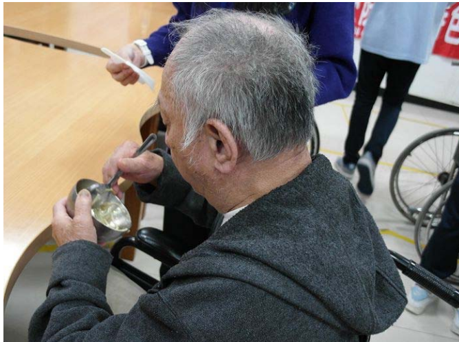
▲ 充滿著感恩與感動的愛心