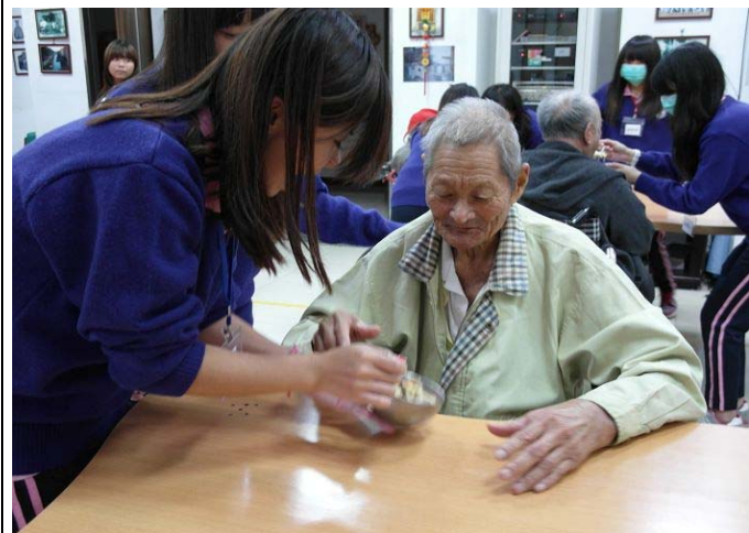
▲ 這碗炒麵在這下午