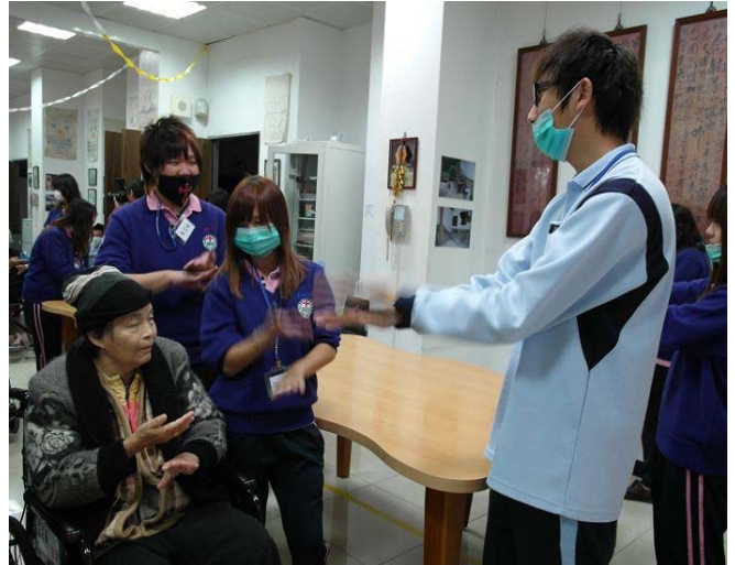
▲ 同學們輔佐著阿公阿嬤