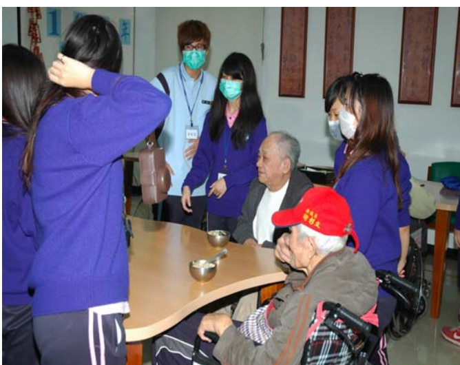
▲ 充滿著感恩與感動的愛心