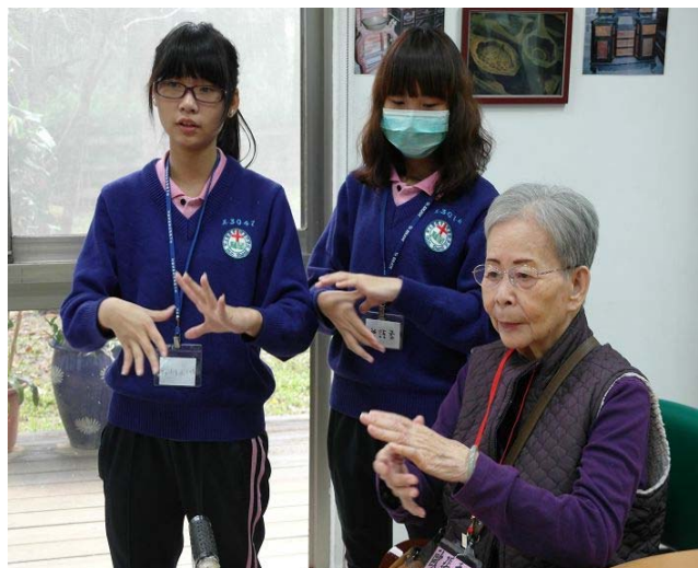
▲ 同學們輔佐著阿公阿嬤