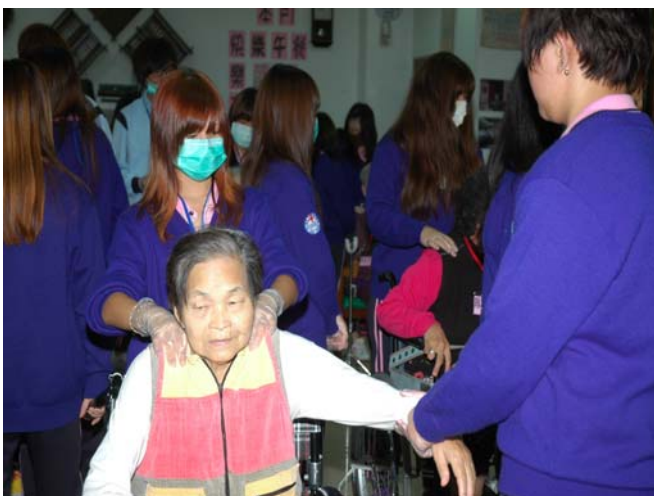
▲ 阿公阿嬤享受著按摩時光