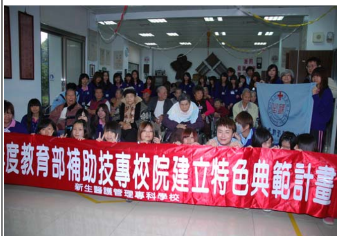
▲ 大合照是我們服務學習的最後留念