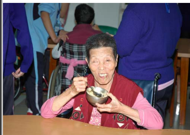
▲ 我們心裡也充滿著感動