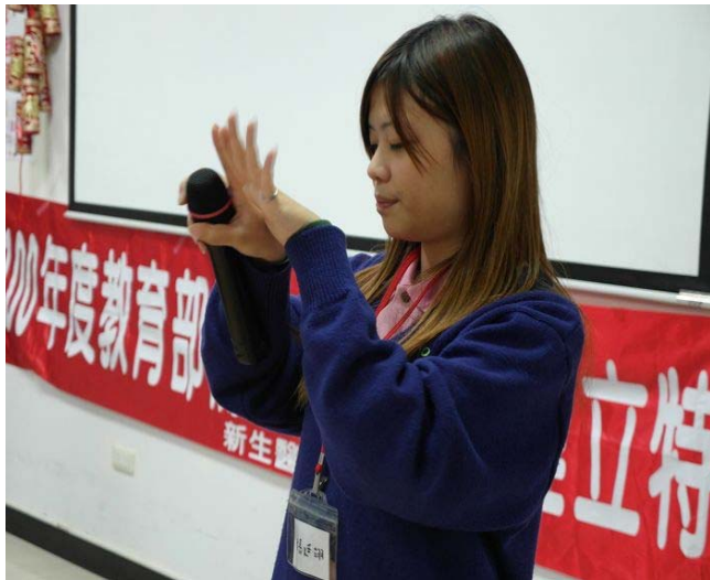
▲ 主持人開始講解我們七巧手的動作