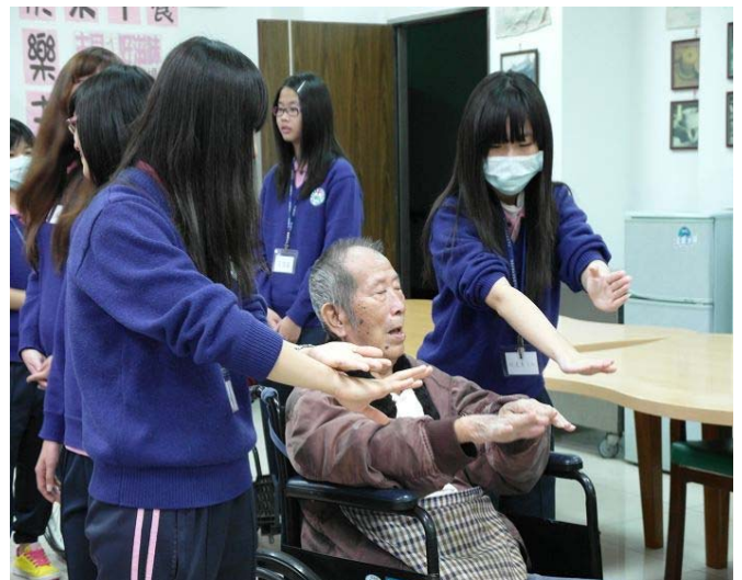
▲ 同學們輔佐著阿公阿嬤