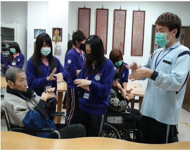
▲ 同學們輔佐著阿公阿嬤